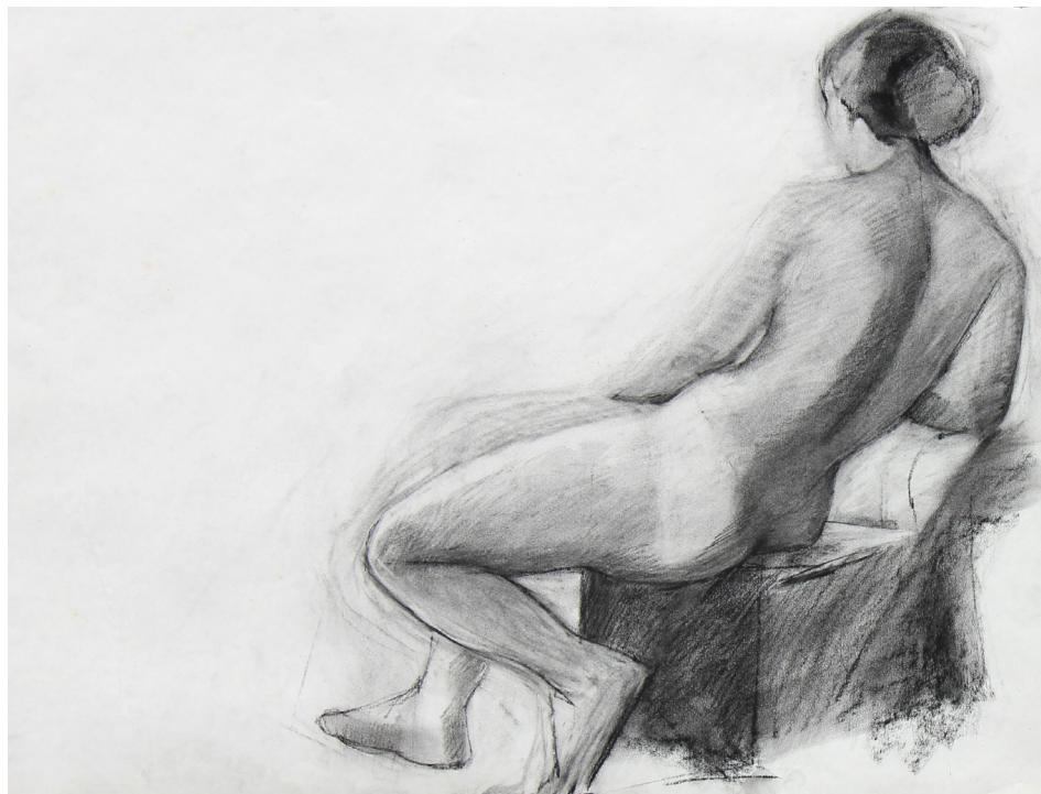
Ženski akt , risba z ogljem, 70 x 50 cm, 1977