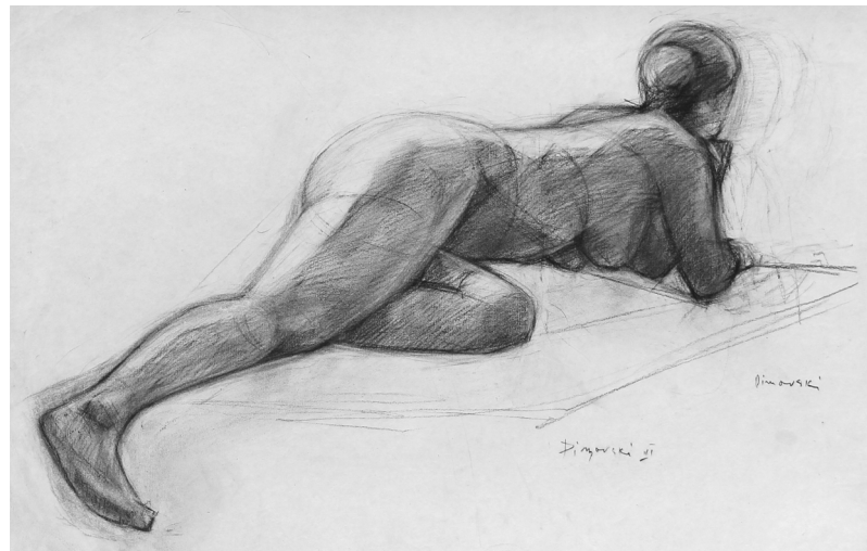
Ženski akt , risba z ogljem, 70 x 50 cm, 1976