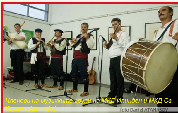
Членови на музичките групи на МКД Илинден и МКД Св. Кирил и Методиј