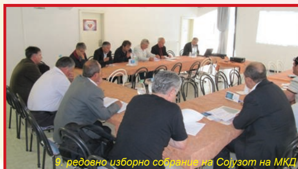
9. редовно изборно собрание на Сојузот на МКД