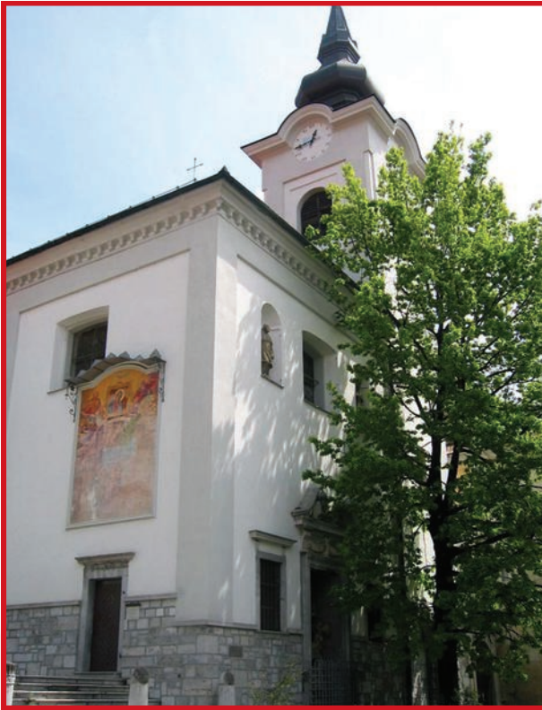
Црквата Св. Климент Охридски (Св. Флоријан) се наоѓа на Горни трг во Љубљана, под Љубљанската тврдина.

ните и земните духови“ (свештеномаченик Игнатиј Богоносец, Посланица до Ефесјаните, 13 глава).