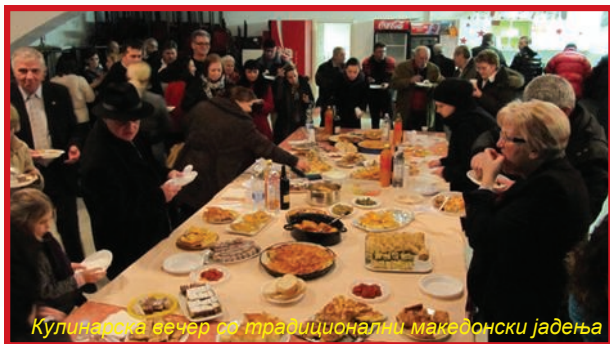
Кулинарска вечер со традиционални македонски јадења

гатата трпеза со разновидни традиционални јадења што ги подготвија кулинарските секции на МКД „Св. Кирил и Методиј“ и КУД ДЕМ беа пофалени од сите гости.