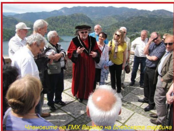
Членовите на ГМХ Вардар на Бледската тербина