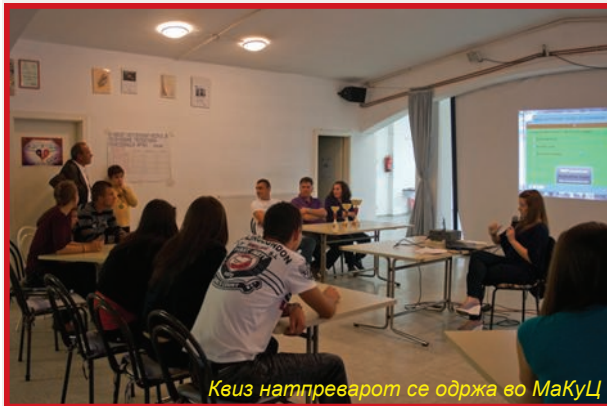
Квиз натпреварот се одржа во МаКуЦ

Љубљана, трети беа нашинците од Постојна и четвртото место им припадна на учениците од Козина Хрпеље.