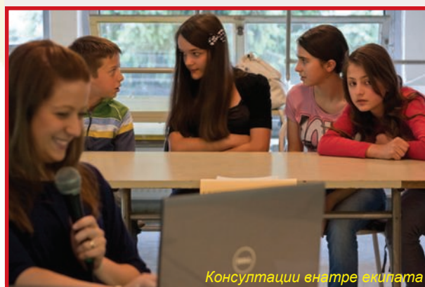
Консултации внатре екипата

На квиз натпреварот свое учество зеда нашите ученици Македонци кои редовно ја посетуваат дополнителната настава по македонски јазик и национална култура на Р. Македонија во Р. Словенија, во градовите: Љубљана, Нова Горица, Козина Хрпеље и Постојна. Нашите ученици се натпреваруваа во здобиените знаења од дополнителната настава по македонскиот јазик и култура, од историјата на македонскиот народ и географија на Република Македонија. И на овај квиз натпревар учениците покажаа одлични знаења. Првото место го освоија учениците од Нова Горица, втори беа учениците од