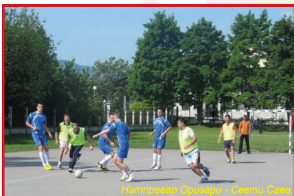
Надпревар Оризари - Свети Сава

Третиот ден од оваа повеќе дневна приредба беше посветен на фудбалот. На ракометното игралиште во ОУ „Луцијан Сељак“ во Стражишче се од-