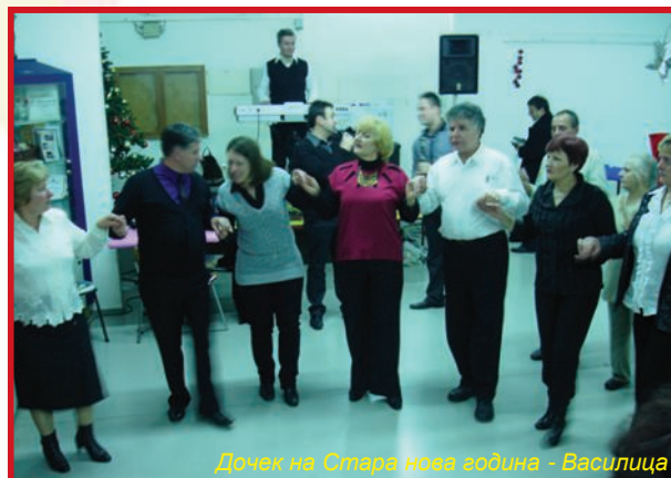
Дочек на Стара нова година - Василица

Дочекот на Православната нова година - Василица беше организиран на 14.01.2012 година, во просториите на Македонскиот културен центар (МаКуЦ) во Крањ. За весело расположение до раните утрински часови на бројните посетители се погрижи ансамблот Амајлија од Скопје.