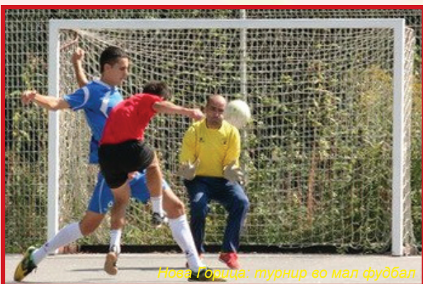
Нова Горица: турнир во мал фудбал