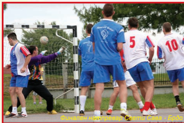
Финален надпревар Свети Сава - Брдо