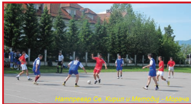
Надпревар Св. Кирил и Методиј - Морача