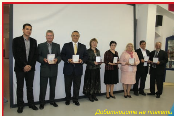
Добитниците на плакети