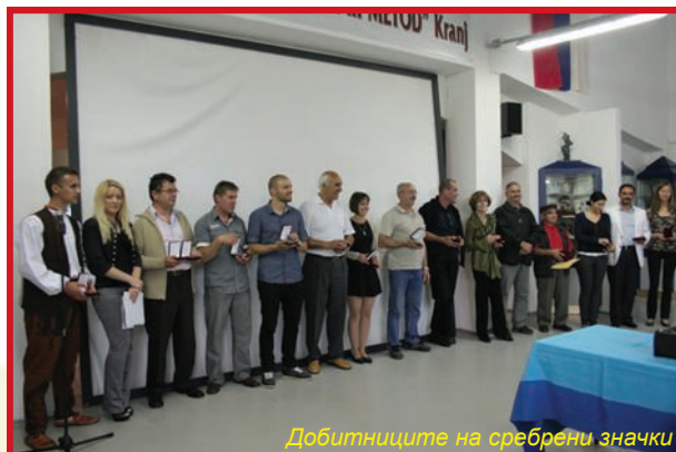
Добитниците на сребрени значки