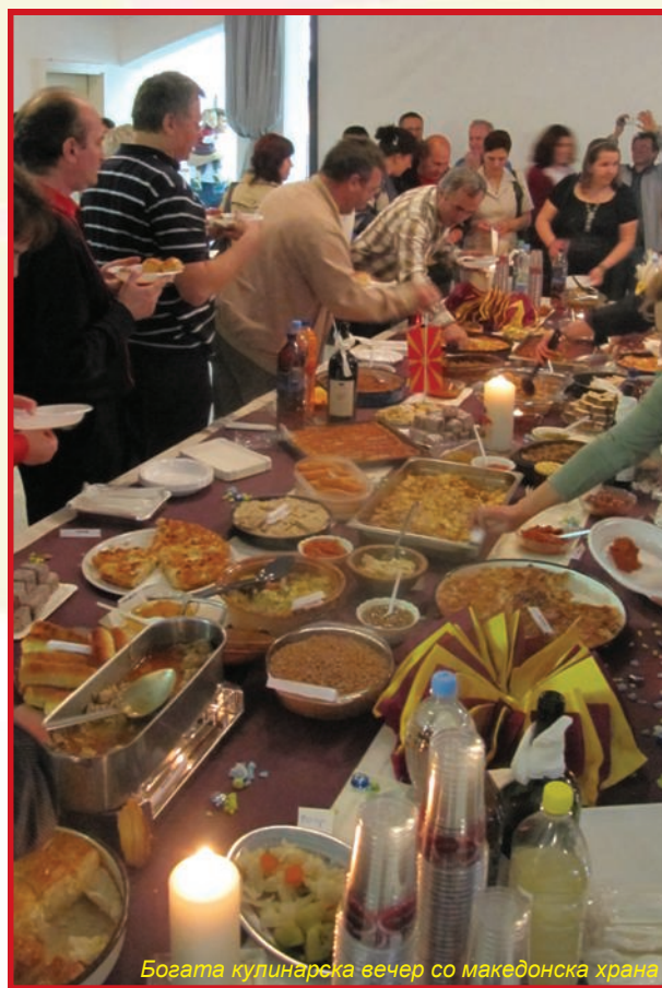
Богата купинарска вечер со македонска храна

Културниот дел на програмата со својот извонреден настап го збогати мешаниот хор Билјана од Љубљана, кои се претставија со песните Гроздено