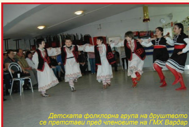
Детската фолклорна група на друштвото се претстави пред членовите на ГМХ Вардар