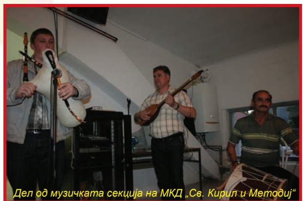
Дел од музичката секција на МКД „Св. Кирил и Методиј“