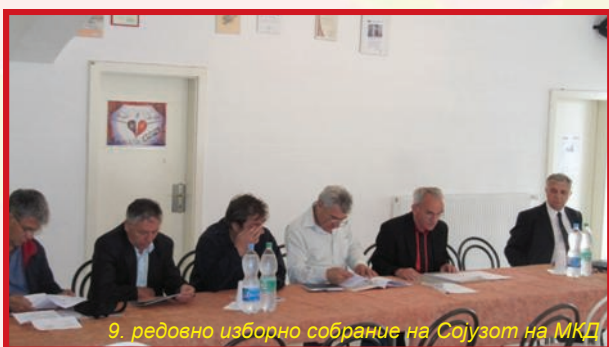
9. редовно изборно собрание на Сојузот на МКД