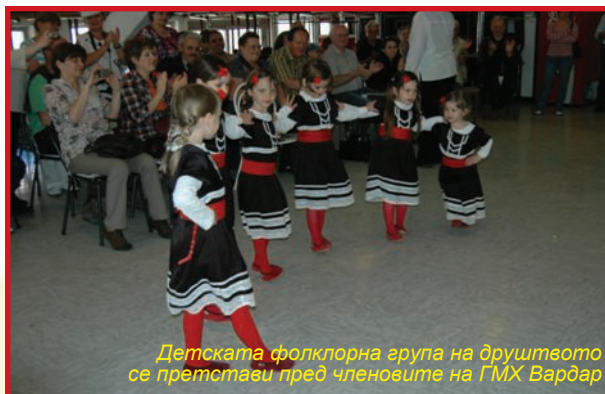
Детската фолклорна група на друштвото се претстави пред членовите на ГМХ Вардар

пријатно изненаден од она што го видел, особено од настапот на најмалите, што говори за големата посветеност кон македонската култура и традиција. Од диригентот Атанасов, дознавме дека градскиот хор Вардар е основан во 2000 година на иницијатива на некогашни хорски пеачи од различни генерации. Репертоарот на хорот содржи