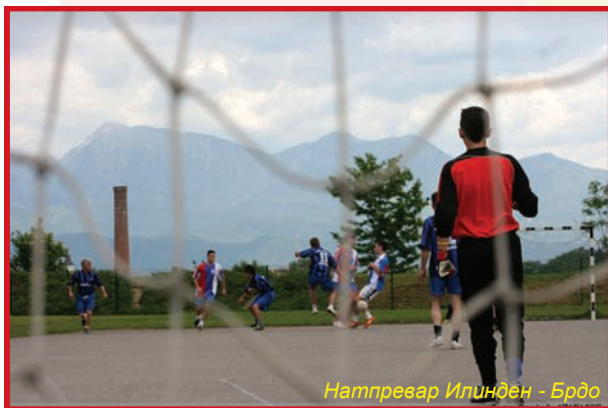
Надпревар Илинден - Брдо

Победник на турнирот беше екипата на СКПД Свети Сава од Крањ, која во финалето, по изведување на пенали ја победи екипата на КД Брдо, исто така од Крањ. Покрај пехарите за најуспешните три екипи, беа поделени и пехар за најдобар голман, кој му припадна на Оштир од Свети Сава и пе-