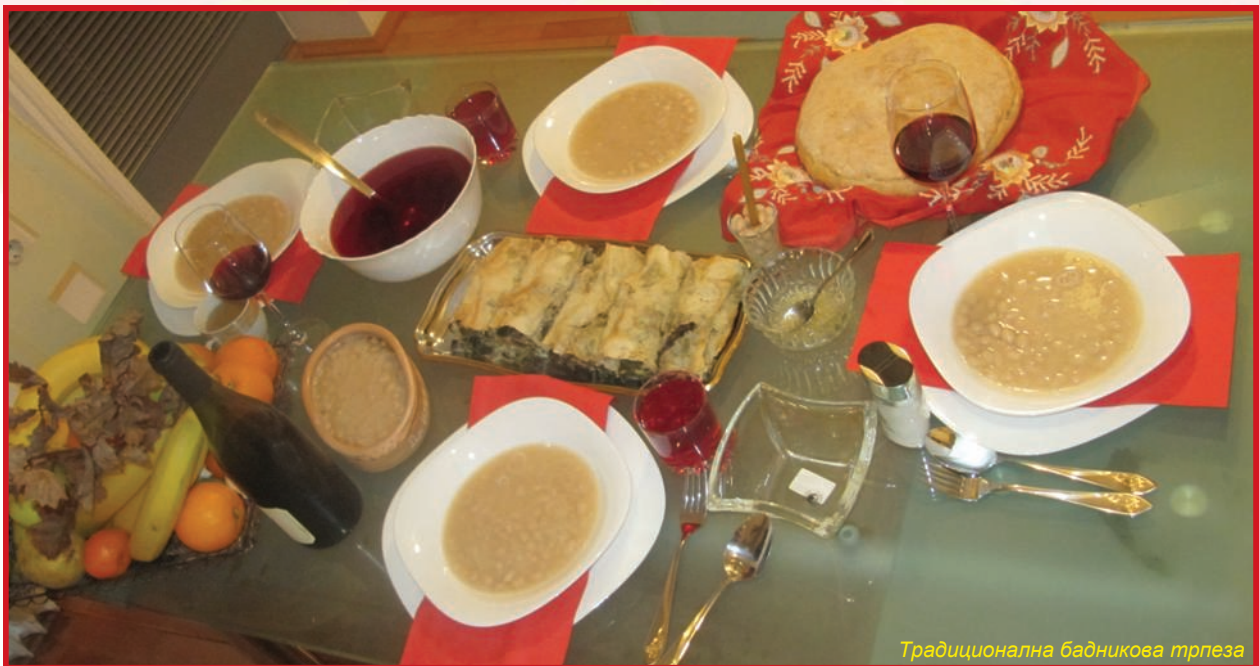
Традиционална бадникова трпеза

Традиционалниот велигденски собор се одржа на пикник просторот Јепрца.