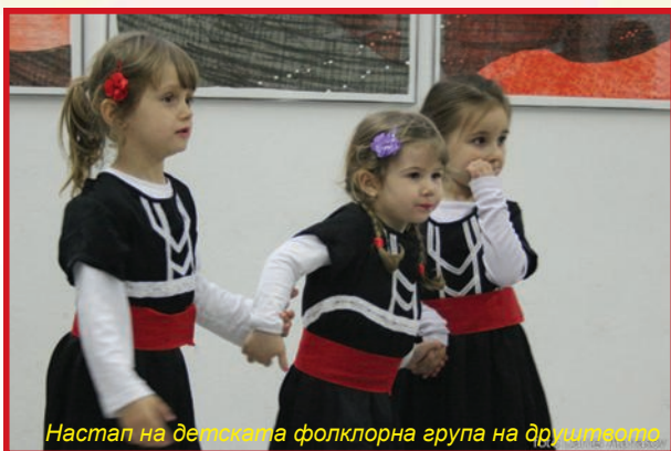
Настап на детската фолклорна група на друштвото