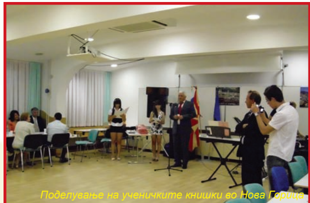
Поделување на ученичките книшки во Нова Горица

И оваа учебна година по 16. пат се собраа сите ученици, кои редовно ја посетуваат дополнителната настава по мајчин македонски јазик во Р. Словенија во градовите: Љубљана, Нова Горица, Козина-Хрпелје и Постојна во Нова Горица. Во преполната сала во средношколскиот дом во Нова Горица учениците пред своите родители, пред членовите на МКД во Република Словенија и пред претставници од Амбасадата на Р. Македонија во Р. Словенија се претставија со културна програма на македонски јазик. Настапија со рецитали, песни и скечеви. За да биде уште побогата програмата ни помогнаа фолклористите од МКД „Свети Кирил и Методиј“ од Крањ, МКД „Илинден“ од Јеснице и домаќините од МКД „Охридски Бисери“ од Нова Горица, кои ни се претставија со ора и песни од нашето македонско поднебје, така да овие млади разиграни срца со својот глас и ритам програмата ја направија уште побогата и повесела. Заедно со учениците и фолкорните секции покажавме во Р. Словенија како треба да се чува, негува, афирмира и анимира македонскиот јазик, култура и фолклор. Само со вакви богати