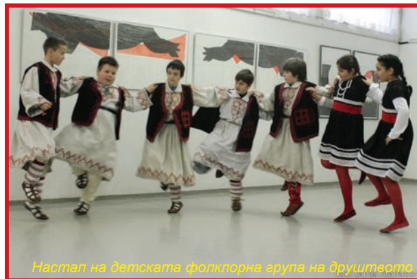
Настап на детската фолклорна група на друштвото

ност во Љубљана дипломирал 1997 година, а магистрирал графика 2002 година. Дејствува како самостоен културен работник. Член е на Сојузот на друштва на словенечки ликовни уметници.