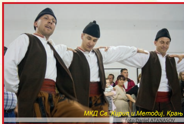
МКД Св. Кирил и Методиј, Крањ