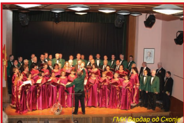
ГМХ Вардар од Скопје

Во тридневна посета на Р. Словенија, од 27. до 29. април годинава беа хористите од градскиот хор Вардар од Скопје. Повод за нивното гостување беше концертот, што го реализираа во соработка со Ловечкиот хор од Медводе, во Културниот дом Сора. Престојот