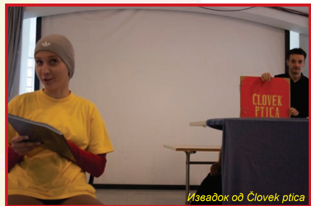
Извадок од Človek ptica

Програмата продолжи со куклената претстава Човек птица (Človek ptica), направена по мотивите на македонската народна приказна Силјан штркот . Приказната зборува за непослушниот и мрзелив Силјан, кој бил истеран од дома и го фаќа татковата клетва да се претвори во птица. На крајот Силјан се враќа дома претворен во човек, а неговите негативни карактеристики се значително искоренети.