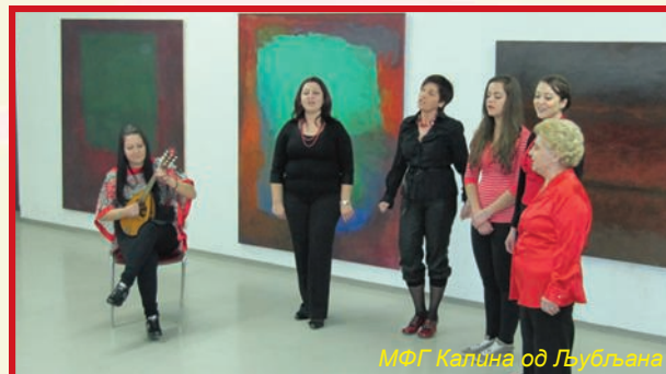
МФГ Калина од Љубљана

Во културната програма се претстави македонската фолклорна група Калина од Љубљана. Во живо ги слушнаваме македонските народни песни На сред село и С каменички фрлат мамо и словенечката народна песна Snočkej sem na vasi bil .