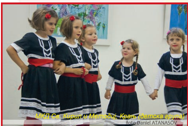
МКД Св. Кирил и Методиј, Крањ (детска група)

Последната вечер од јубилејните 20. Денови на Св. Кирил и Методиј изобикуваше со фолклор. Македонски групи од Словенија и Австрија се претставија со квалитетни настапи. Учествуваа фолклорните групи на МКД „Св. Кирил и Методиј“ од Крањ (деца и возрасни), МКД „Илинден“ од Јесенице (јуниори и сениори), МКД „Охридски бисери“ од Нова Горица и пејачката група на МКД