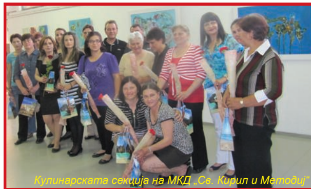
Купинарската секција на МКД „Св. Кирил и Методиј“