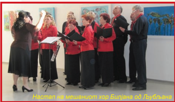
Настап на мешаниот хор Билјана од Љубљана