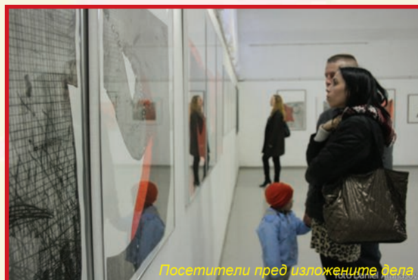
Посетители пред изложените дела

Програмата беше збогатена со настапот на детската фолклорна група на МКД „Св. Кирил и Методиј“, кои се