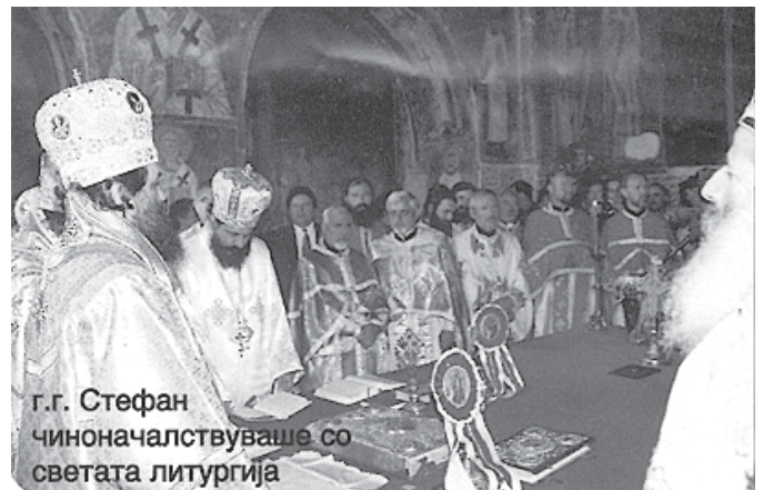
г.г. Стефан чиноначалствуваше со светата литургија

во името на Христа - основачот на светата црква, и недоразбирањата, и негирањата и неорифаќањата на помалите и непризнати цркви, меѓу кои е и Македонската православна црква. Православието мора што поскоро да ги реши наталожените, децении и столетија, прашања од канонски, административен, или било кој друг аспект. Вистината и правдата македонска мора да бидат задоволени пред сите вистински последователи на Христа. Овој наш апел, од ова свето место, нека биде подадена рака кон сите православни помесни цркви, со искрена желба да бидеме и едно и заедно во Христа. Во тој поглед, особено, можат да ни помогнат соседните православни цркви, зашто тие најмногу знаат за Македонија, за македонскиот православен народ, за Македонската православна црква. Последниве години се почести се контактите со соседните сестрински православни цркви и можеме да очекуваме тие да прераснат во постојано меѓусебно почитување и прифаќање. Верувам дека во новиот милениум ќе зачекориме со ногу радости и на национален и на црковен план. Самостојната и суверена македонска држава и афтокефалната Македонска православна црква, се непобитен факт дека на нашата генерација и се падна во чест да го доживее исполнето македонско време, време - желба на многу македонски генерацији пред нас. Но, на оваа наша генерација по Божја вола и падна и во долг да ја пренесе и