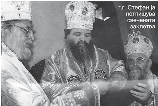
г.г. Стефан ја потпишува свечената заклетва

Нипшто не станува без Бога и секиј од нас, со негова помош,