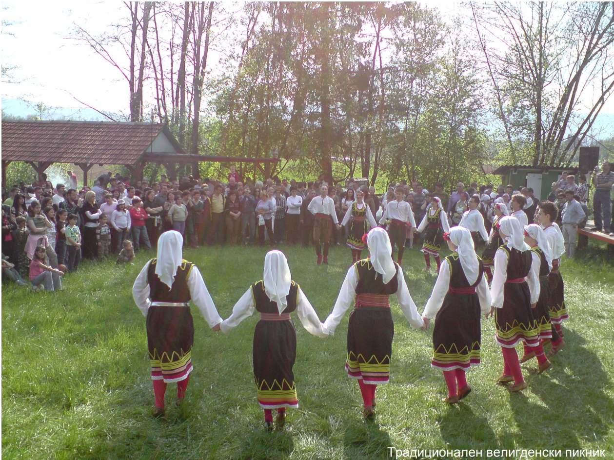
Традиционален велигденски пикник

Прославата продолжи следниот ден, во недела (27.4.2008), со одржување на света утринска божествена литургија, по која верниците кои за дочек на празникот Велигден се подготвуваа со велигденски пост кој трае 7 седмици, пристапија кон причест, со цел соединување со телото Христово.