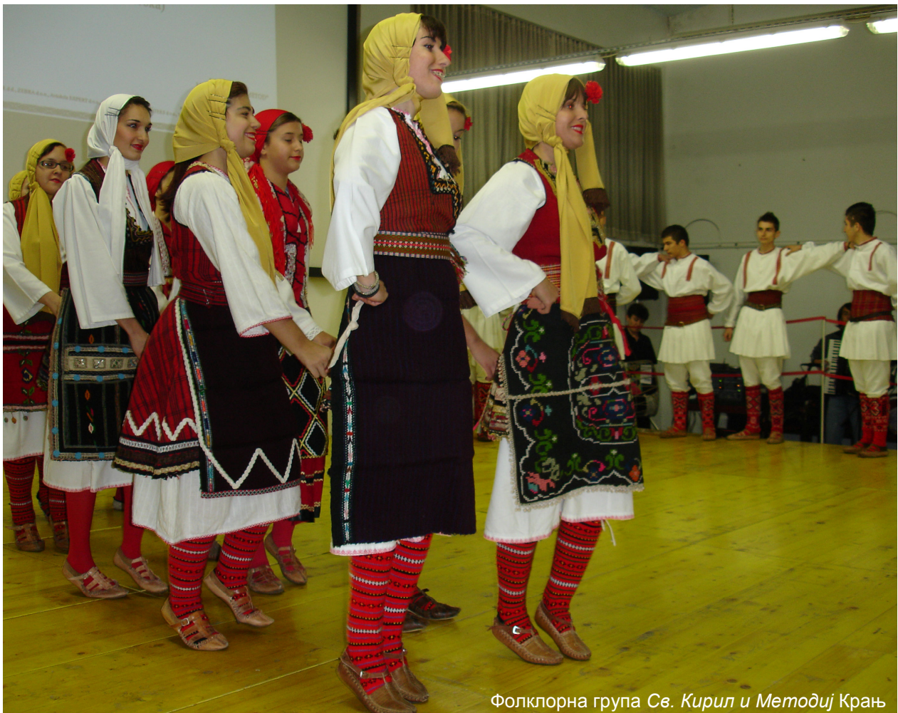
Фолклорна група Св. Кирил и Методиј Крањ

Продолжувајќи ја традицијата за зачувување на изворниот фолклор на сцената во Македонскиот културен центар во Крањ, настапија четиринаесет претставници на фолклорот, меѓу кои, македонските фолклорни групи Св. Кирил и Методиј , Илинден од Јесенице и Билјана од Марибор. Гости на деветиот Етно-фолк беа македонската фолклорна група и ансамбл Љупчо Сантов од Оризари – Кочани. Со својот настап уште еднаш потврдија дека се вистински амбасадори на фолклорот од Осоговскиот крај на Македонија.