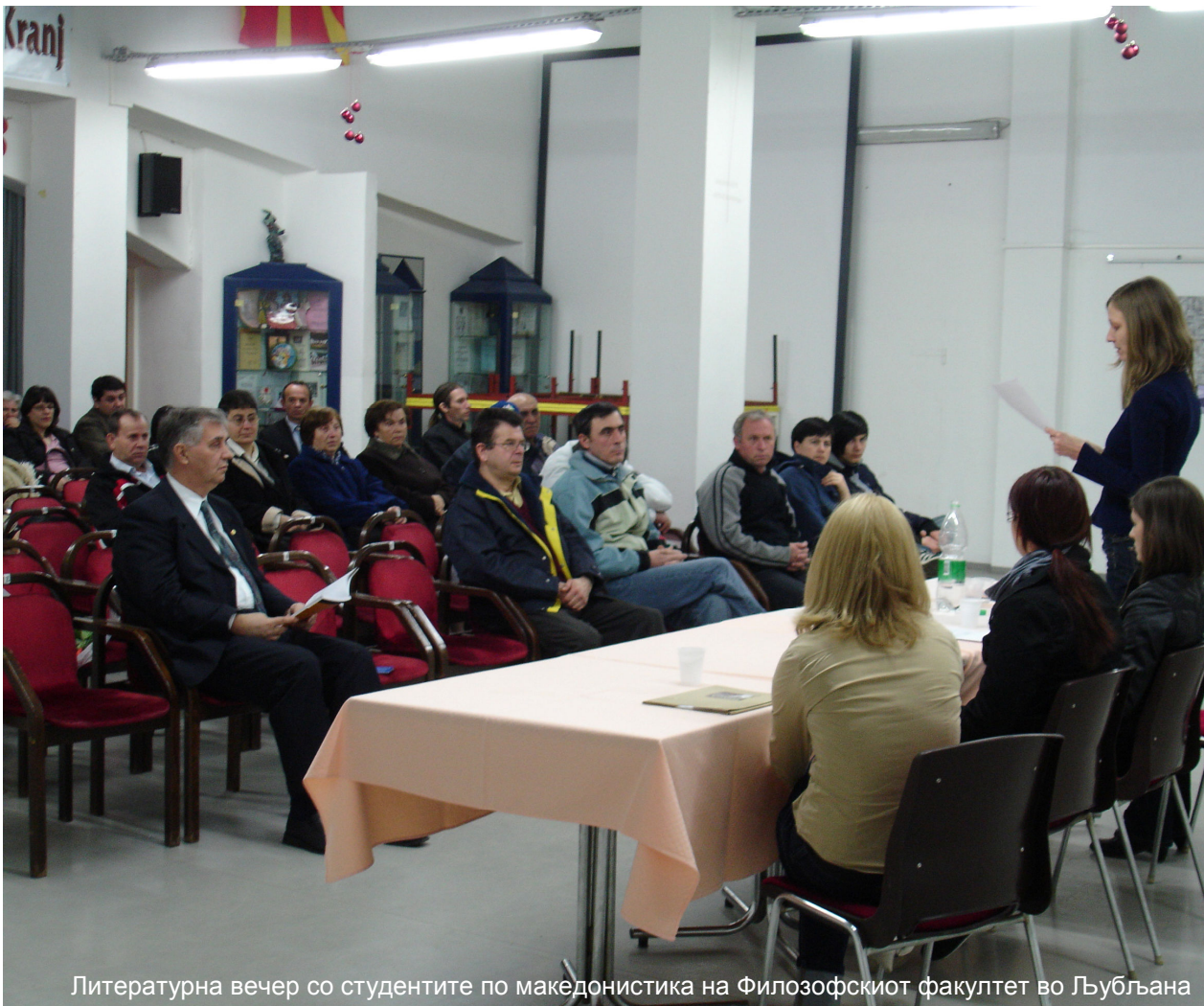
Литературна вечер со студентите по македонистика на Филозофскиот факултет во Љубљана

Во рамките на културната програма, концерт одржа Крањскиот квинтет. Крањскиот квинтет е културно друштво кое на музичката сцена успешно опстојува речиси 15 години. Имаат издадено две ЦД-иња со